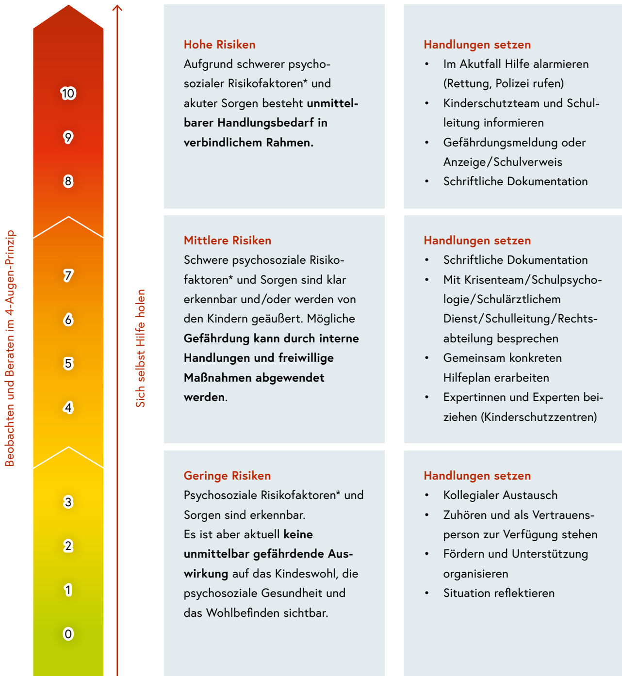
Abbildung: Sorgenbarometer